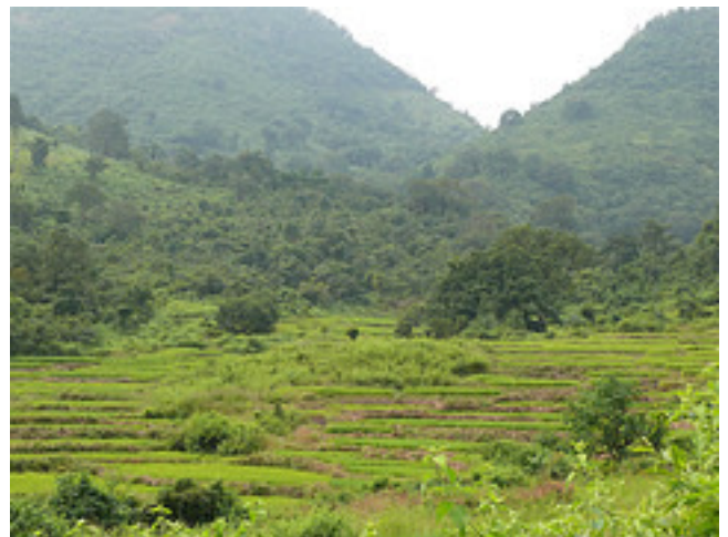
Chatikona, Rayagada-Distrikt, im Südwesten Orissas: Hier leben sehr viele Adivasi vom Volk der Dongria Kondh. 84 Prozent der Bauxit-Vorkommen Orissas befinden sich im Distrikt Rayagada.

Grundannahme hinsichtlich der Auswirkungen von Industrieansiedlungen auf die Lebensbedingungen der Menschen ist, dass diese ihre traditionelle Ökonomie und die Art der Nahrungsbeschaffung verändern können. In Wirklichkeit können dies nur sehr wenige: Für die meisten kann die Industrialisierung zu Armut, Marginalisierung und Entfremdung führen. Angehörige der Indigenen- und Dalit-Gemeinschaften verfügen in den wenigsten Fällen über die Qualifikationen, die für die angebotenen Jobs benötigt werden. Die UVPs berücksichtigen nicht die Bedeutung des Waldes für die Lebens- und Arbeitsweise der Adivasi; sie sagen nichts darüber, wie der Verlust des Waldes die Überlebensfähigkeit beeinträchtigt.